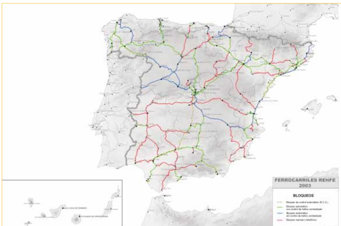
FIGURA 17. Red ferroviaria española. Sistemas de seguridad y bloqueo