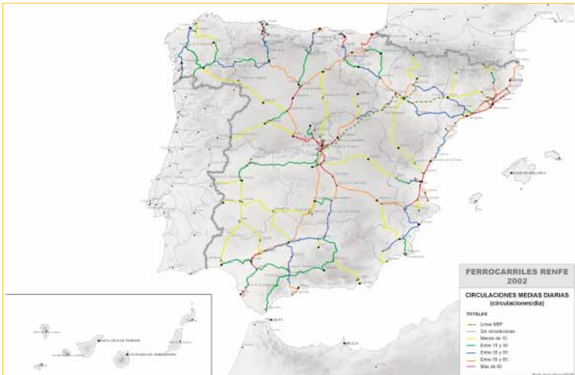
FIGURA 16. Circulaciones medias diarias en la Red de RENFE

tará para ello la presencia del ferrocarril en nuevas áreas del transporte de mercancías, facilitando el acceso de nuevos operadores ferroviarios y favoreciendo la cooperación entre operadores ferroviarios y de otros modos, nacionales y extranjeros, con la participación activa de los cargadores del sector industrial y de servicios. Apoyo a la actividad de los operadores ferroviarios para mejorar su inserción en las cadenas logísticas multimodales.